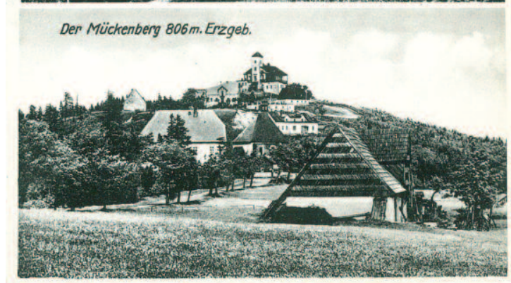
Hostinec U Zotavení, Horní Krupka a Komárka