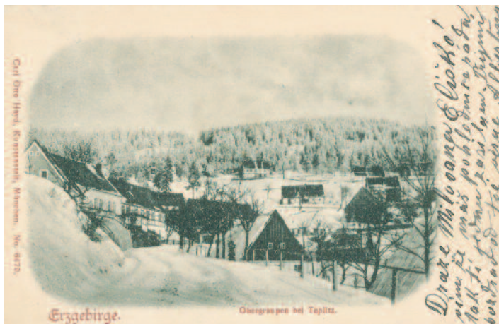
Horní Krupka, silnice na Komář hůrku