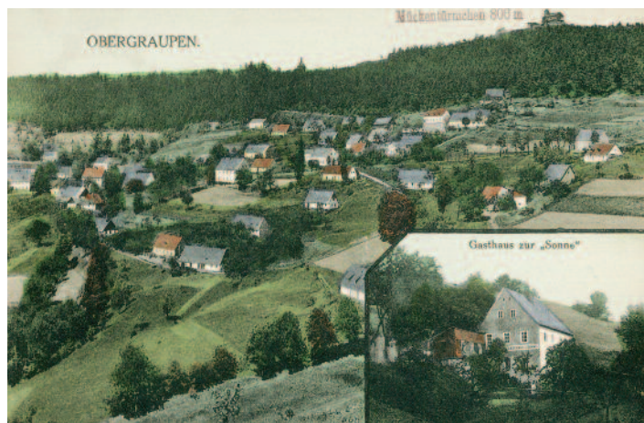
Horní Krupka, Hostinec U Slunce